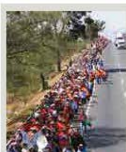
Récord: pasan tres millones de peregrinos

Temporada navideña San Mateo Atenco inicia un amplio operativo policiaco EQUIPO MILENIO - PÁGS