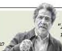
Rafael Pérez Gay "La noche: tengo cuatro monstruos en el cajón del buró" - P.11

Duarte. El secretario general de Gobierno advirtió que se ha detectado la pugna, pero aseguró que no hay registro de algún incremento en la incidencia delictiva