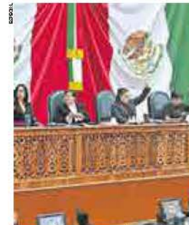
Para el delito de abuso sexual se impondrá una pena de 2 a 7 años de prisión.