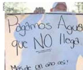
En Los Reyes La Paz, los habitantes realizaron un bloqueo en el paraje La Festival.