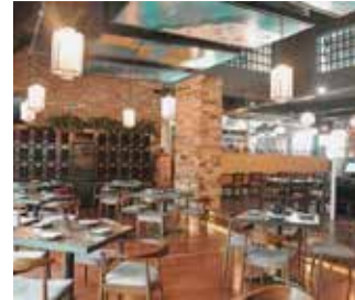
Los restaurantes del Valle de Toluca se preparan para recibir al turismo del mundial

Valle de Toluca destacó que regularmente se trabaja en coordinación con Canirac nacional y Canirac Ciudad de México, y ahora con la celebración del Mundial 2026 no será la excepción.