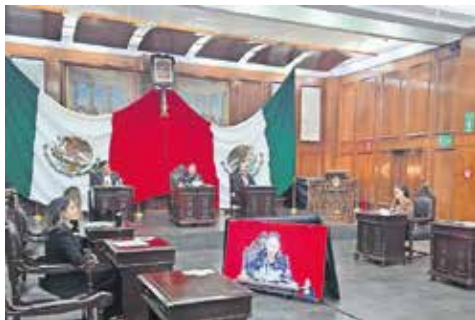
Proponen la derogación del delito de extorsión del artículo 266 del Código Penal estatal, en atención a la facultad exclusiva del Congreso de la Unión para legislar sobre su tipificación.