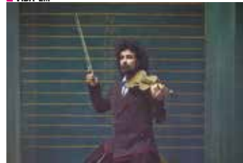
NE TOLUCA/ANA SANCHEZ