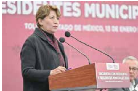
La gobernadora Delfina Gómez se reunió con alcaldes mexiquenses