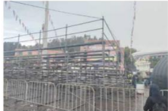
Las instalaciones habilitadas para los Destinos Futboleros fueron medio vacías

Toluca La Confederación de Cámaras Nacionales de Comercio, Servicios y Turismo Concanaco estimó que las graduaciones escolares en este 2026, generarán una derrama económica cercana a los 15 mil 300 millones de pesos, lo que representaría un impulso entre el 7 y 10 por ciento el nivel de ventas tradicional de los servicios y del comercio. (MÁS INFORMACIÓN PÁG 4A KARINA VILLANUEVA)