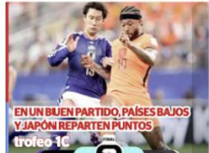
EN UN BUEN PARTIDO, PAÍSES BAJOS Y JAPÓN REPARTEN PUNTOS trofeo 1C