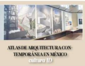
ATLAS DE ARQUITECTURA CON TEMPORÁNEA EN MÉXICO cultura 1D