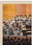
ORQUESTA SINFÓNICA NACIONAL JUVENIL DE MÉXICO OFRECERÁ CONCIERTO cultura ID