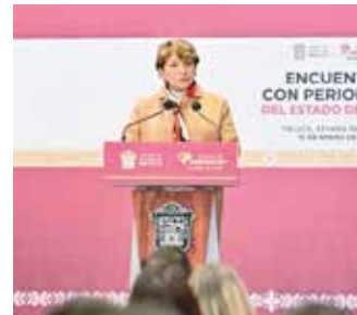
La gobernadora, Delfina Gómez, se reunió con representantes de los medios de comunicación

“Con ello, la transformación que está llegando a todos los rincones de nuestra geografía y posicionando a nuestro Estado como un referente nacional”, aseguró.