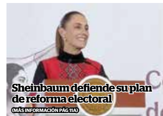
Sheinbaum defiende su plan de reforma electoral (MÁS INFORMACIÓN PÁG 11A)