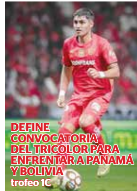
DEFINE CONVOCATORIA DEL TRICOLOR PARA ENFRENTAR A PANAMÁ Y BOLIVIA trofeo 1C