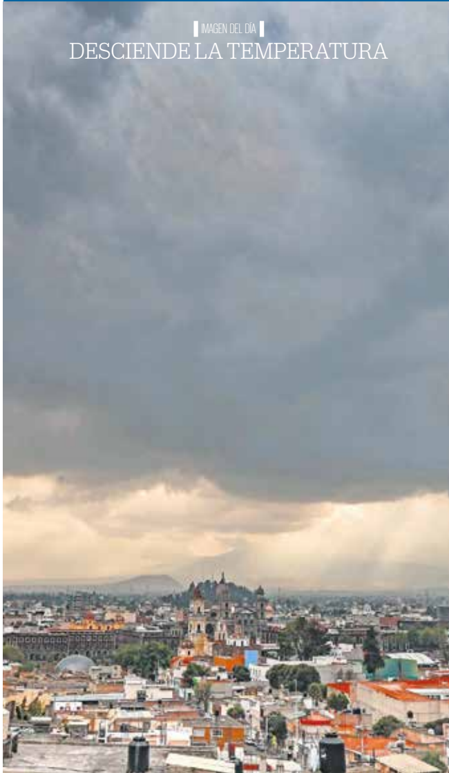
IMAGEN DEL DÍA DESCIENDE LA TEMPERATURA

Toluca, Méx. — El descenso térmico ya se siente en la capital del Estado de México, donde el lunes se registraron 2 grados centígrados, la temperatura más baja de la temporada, debido al frente frío número 27. Además, lluvias ligeras y nubosidad persistente mantienen un ambiente frío y gris en Toluca y gran parte del territorio mexiquense.