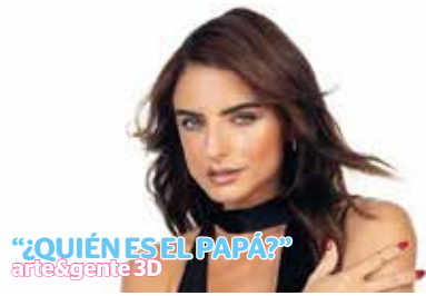
“¿QUIÉNES ES EL PAPÁ?” arte&gente 3D