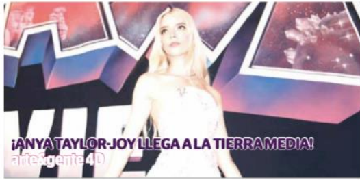
ANYA TAYLOR-JOY LLEGA A LA TIERRA MEDIA! artealameda