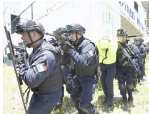
Estará blindada la seguridad durante el mundial

"El grupo táctico reporta total disponibilidad y adiestramiento para ac-