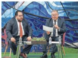
La bolsa para operar el esquema este 2026 es de 53 millones de pesos.