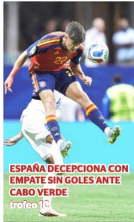
ESPAÑA DECEPCIONA CON EMPATE SIN GOLES ANTE CABO VERDE trofeo 1C