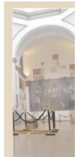
LABORATORIO ARTE ALAMEDA PRESENTA NUEVO CICLO EXPOSITIVO la cultura