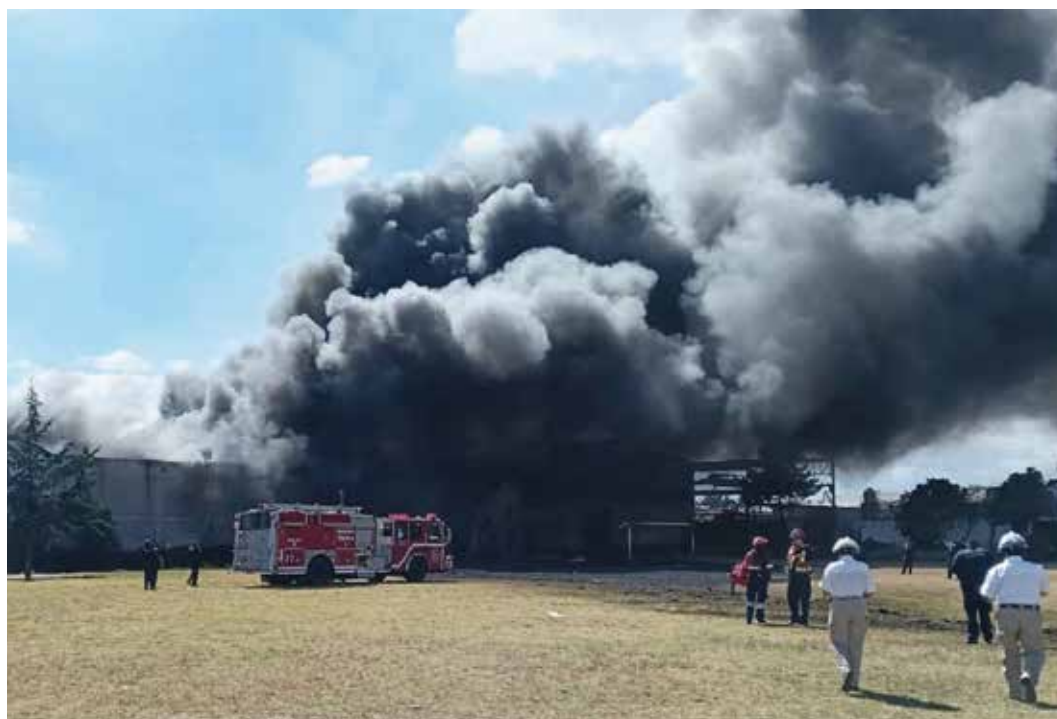
El sitio donde cayó la aeronave almacenaba combustibles y tanques, las autoridades lograron contener riesgos. ESPECIAL