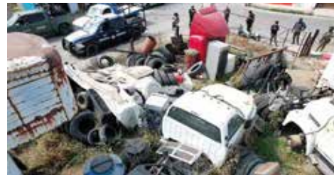
Combate fiscalía mexicana robo a transportistas

asegurados se encuentran 58 bodegas, 23 domicilios particulares, 23 lugares de encierro, una empresa de monitoreo, tres deshuesaderos, 22 cachimbas, dos lugares de venta irregular, y cuatro restaurantes. Finalmente, entre los indicios asegurados destacan 178 vehículos de transportes, placas de circulación de vehículos con reporte de robo, así como 535 mil pesos en moneda nacional y extranjera.