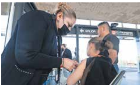
La mayoría de los casos identificados en la entidad se concentran en la zona oriente.

La entidad se ubica como la quinta con más contagios en el país durante 2026; autoridades de la Secretaría de Salud de México reportan que no han registrado decesos y que la incidencia está por debajo de la media nacional. Hasta ahora se han registrado 849 casos probables y 214 confirmados en el periodo 2025-2026. La mayoría de los contagios se concentran en la zona oriente, aunque también han detectado en municipios como San José del Rincón, Amanalco y Valle de Bravo. ● Gobierno A3