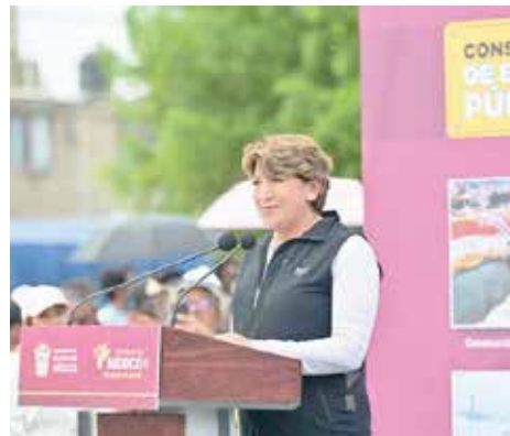
La gobernadora Delfina Gómez inauguró obra prioritaria para la gente en el oriente EdoMex

mos trabajando en coordinación con las autoridades municipales, con austeri-