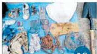
FLORES EN EL CORAZÓN

MARQUESA Madres buscadoras localizan prendas Aunque no han localizado restos humanos, el colectivo Flores en el Corazón continúa con actividades en Tercera Búsqueda Intermetropolitana. P. 17