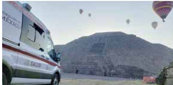
El operativo abarcará 15 zonas arqueológicas y espacios ceremoniales

Bajo el lema "Esto que ves, lo hacemos juntos", arrancó en el Estado de México la Colecta Anual de la Cruz Roja Mexicana 2026 que tiene como objetivo reforzar las acciones de la institución en los llamados de emergencia y ayuda humanitaria. —(MÁS INFORMACIÓN PÁG 4A Arell Díaz)