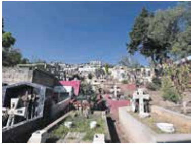
La vigilancia y protección estarán a cargo de la administración municipal.