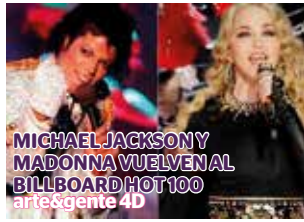
MICHAEL JACKSON Y MADONNA VUELVEN AL BILLBOARD HOT 100 arte&gente 4D