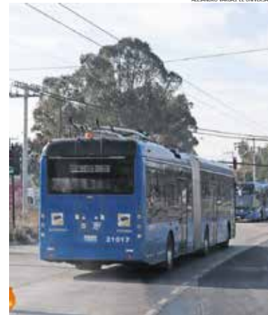
El trolebús opera con unidades eléctricas y forma parte de la expansión del transporte público masivo en el Estado de México.

● El dato El sistema eléctrico redujo significativamente los tiempos de traslado entre el oriente mexicano y la Ciudad de México.