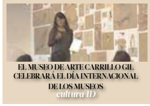
EL MUSEO DE ARTE CARRILLO GIL CELEBRARÁ EL DÍA INTERNACIONAL DE LOS MUSEOS cultura 1D