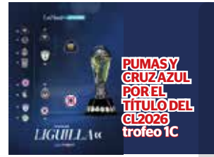
PUMAS Y CRUZAZUL POR EL TÍTULO DEL CL2026 trofeo 1C