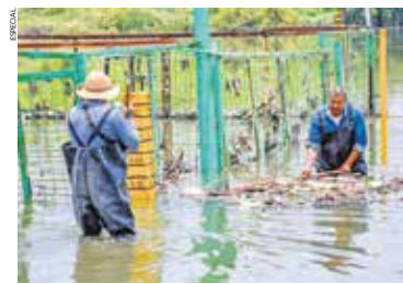
Las zonas metropolitanas concentran el mayor riesgo de inundaciones en el Estado de México.