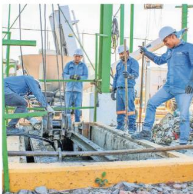
El eje con mayor número de iniciativas es Empleo Digno y Desarrollo Económico, con 35 proyectos.