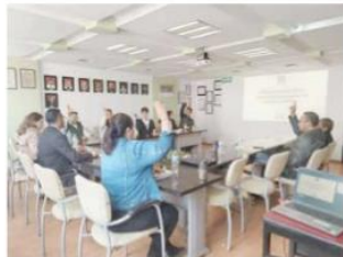
La UAEMéx trabaja en el análisis del Anteproyecto de Reforma a la Ley Universitaria

¡MÁS INFORMACIÓN PÁG 3A KARINA VILLANUEVA