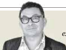
Sergio Hernández "Mentiras sobre la exposición en los muros de Los Pinos" - P. 25