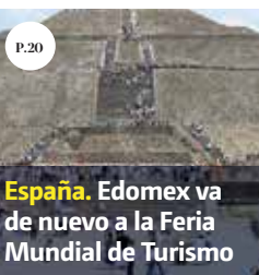
España. Edomex va de nuevo a la Feria Mundial de Turismo