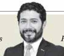
Marath B. Bolaños "Paso decisivo en la Primavera de derechos laborales" - P. 14

Sin distinción. Los hologramas que se hayan expedido en verificentros de Ciudad de México, Hidalgo, Morelos, Puebla, Querétaro y Tlaxcala, tendrán valor para circular en esta región central de la entidad