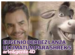
EUGENIO DERBEZ LANZA ULTIMÁTUM PARA SHREKS arte&gente 4B