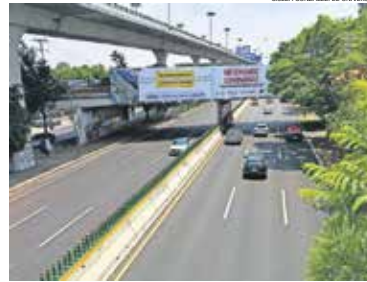
GISELA GONZÁLEZ, EL UNIVERSAL

La vialidad recibió mantenimiento integral tras cuatro meses y medio de intervención, periodo en el que realizaron diversos trabajos.