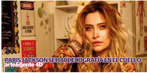
PARIS JACKSON SE HACE ECOGRAFÍA EN EL CUELLO arte & gente 4D