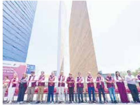
Con la rehabilitación del Periférico Norte, el gobierno estatal materializa el lema '2026. Año de las Obras en EdoMéx'