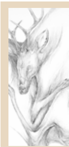
PRESENTARÁN EN EL LAGO LA NUEVA EDICIÓN DE LA CARPETA GRÁFICA VENADO Id cultura