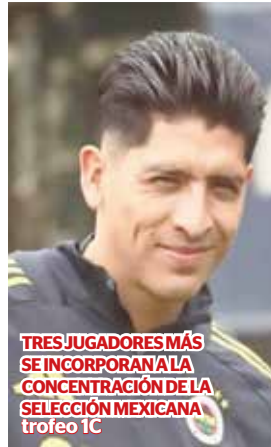
TRES JUGADORES MÁS SE INCORPORAN A LA CONCENTRACIÓN DE LA SELECCIÓN MEXICANA trofeo IC