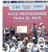
La vigencia del registro de marca será hasta el 22 de mayo de 2036.