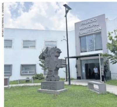
Presentaron denuncias ante la Fiscalía General de Justicia del Edomex.

Auditorías practicadas por la Contraloría Municipal y el OSFEM al ejercicio fiscal 2024 detectaron un posible daño al erario por más de 417 millones de pesos en Cuautitlán México; las observaciones derivaron en denuncias ante la Fiscalía estatal y procedimientos contra exservidores públicos por presuntas irregularidades en obra pública. ● Municipios A5