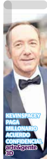
KEVIN SPACEY PAGA MILLONARIO ACUERDO CONFIDENCIAL arte&gente 3D