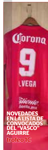
NOVEDADES EN LA LISTA DE CONVOCADOS DEL “VASCO” AGUIRRE trofeo 1C