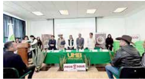
Productores mexiquenses de varios municipios participaron en el encuentro

La producción de agave sería a través de procesos de transición ecológica para la preservación de especies nativas, además de fomentar la llamada economía circular para reducir los gases de efecto invernadero en las zonas metropolitanas tanto del Valle de Toluca como del Valle de México.