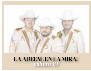
LA ADEEM ¡EN LA MIRA! cultura 1D