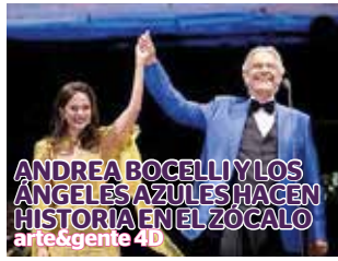
ANDREA BOCELLI Y LOS ANGELES AZULES HACEN HISTORIA EN EL ZÓCALO arte&gente 4B