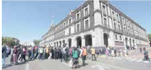
El gobierno mexiquense se prepara para el simulacro nacional

Para la ocasión se prevé la participación de dependencias de los tres órdenes de gobierno, junto con los sectores privado, social y académico, para fortalecer la ejecución de las medidas de respuesta, evacuación o repliegue en inmuebles, así como la revisión de rutas de emergencia, puntos de reunión y zonas de menor riesgo.