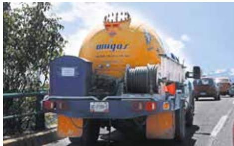
Los operativos se planifican mediante filtros, de manera similar a los alcoholímetros, situados en puntos estratégicos y vías principales.

circulan en el municipio de Toluca, situación que ha encendido las alarmas de la Protección Civil.