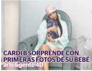
CARDI B SORPRENDE CON PRIMERAS FOTOS DE SU BEBÉ arte&gente 4D