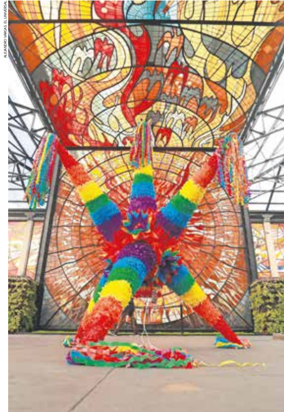
Toluca, Méx. — La tradicional piñata de Acolman avanza hacia su reconocimiento oficial, una distinción que fortalecería el trabajo de sus artesanos, mientras la Feria Internacional celebra cuatro décadas de historia y creatividad. | MUNICIPIOS A8 |