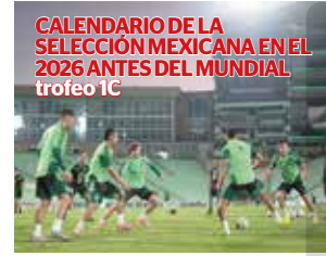
CALENDARIO DE LA SELECCIÓN MEXICANA EN EL 2026 ANTES DEL MUNDIAL trofeo 1C