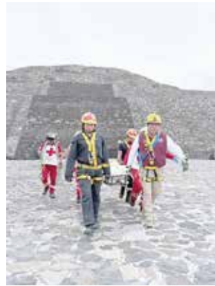
Un hombre desconocido disparó a visitantes en la Zona Arqueológica de Teotihuacán

Aseguró que se tomarán las acciones preventivas pertinentes para evitar que un hecho de esta índole se repita. Los hechos se registran a casi 50 días de que inicie la Copa del Mundo 2026, y uno de los sitios turísticos que se espera sean de los más visitados es justamente la zona arqueológica, a decir de las autoridades correspondientes.