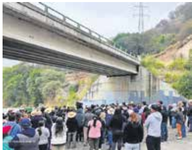
Autoridades confirmaron presencia de gasolina premium en el sistema hídrico.