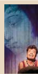
"YO MARCOS", UNA REFLEXIÓN ESCÉNICA SOBRE LA IDENTIDAD Y LA MEMORIA Id cultura