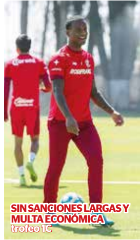
SIN SANCIONES LARGAS Y MULTA ECONÓMICA trofeo 1C