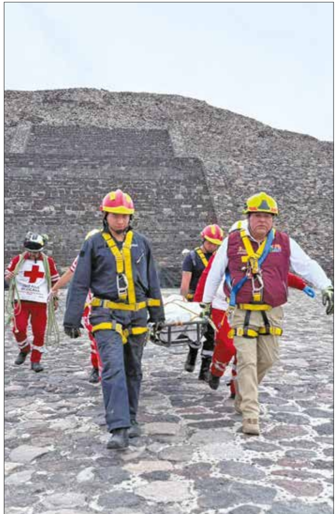
▲ El ataque perpetrado por una persona (que hasta el cierre de esta edición no había sido identificada) dejó como saldo la muerte de una mujer de nacionalidad canadiense y del propio atacante, además de 13 personas que resultaron heridas, todas ellas de origen extranjero y entre los cuales se encuentran dos menores de edad, indican reportes oficiales. Las autoridades de procuración de justicia aún investigan cómo es que el agresor logró ingresar las armas y municiones al sitio arqueológico de Teotihuacán.