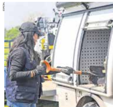
Se contempla el intercambio de información sobre desapariciones en México y Estados Unidos.