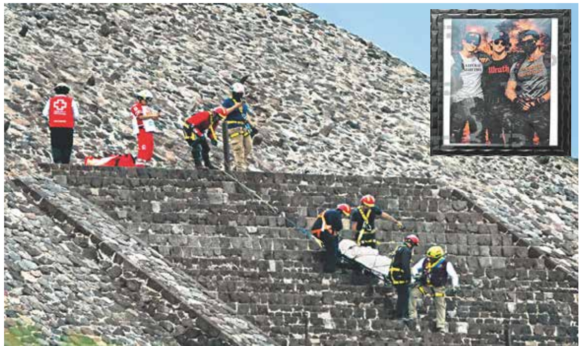
Personal de la Cruz Roja y forense retiran un cuerpo de la Pirámide de la Luna, donde hubo además 13 heridos.