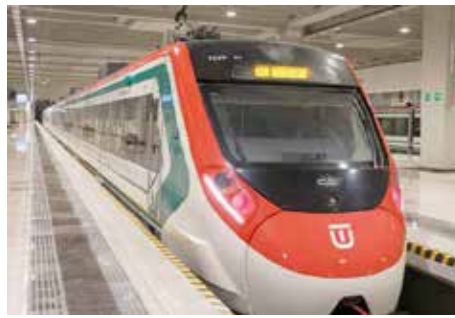
La tarifa del Tren Suburbano Felipe Ángeles aumentará tras el precio de promoción que se implementó en la inauguración

Para hacer uso del Tren, es indispensable la Tarjeta de Movilidad Integrada, la cual, establece el reglamento, es personal e individual, de forma que sólo puede ser utilizada por una sola persona en cada trayecto.