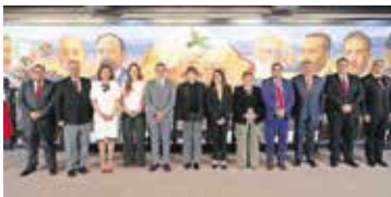
La gobernadora Delfina Gómez también realizó seis nombramientos en áreas laborales y de movilidad.