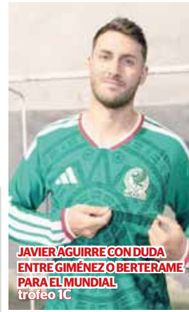
JAVIER AGUIRRE CON DUDA ENTRE GIMÉNEZ O BERTERAME PARA EL MUNDIAL trofeo 1C