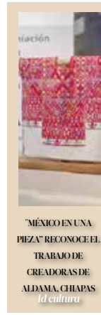
"MÉXICO EN UNA PIEZA" RECONOCE EL TRABAJO DE CREADORAS DE ALDAMA, CHIAPAS la cultura