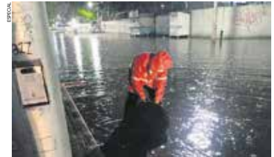
Mantienen labores de desazolve, monitoreo permanente y protocolos de respuesta inmediata.