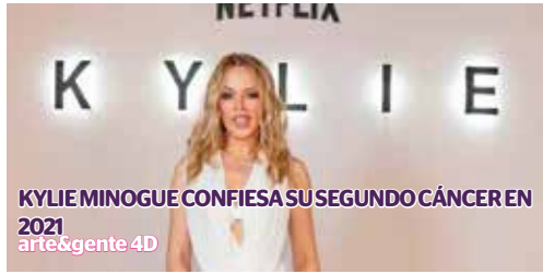
KYLIE MINOGUE CONFIESA SU SEGUNDO CÁNCER EN 2021 arte&gente 4D