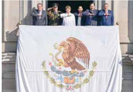
La gobernadora Delfina Gómez disfrutó del desfile desde el Palacio de Gobierno