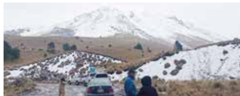
Conductor de un vehículo tipo razer fue detenido por subir al Nevado, una zona prohibida