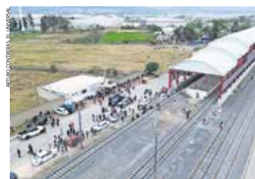
Exigen el cumplimiento de acuerdos relacionados con pagos por tierras ejidales y obras de infraestructura vial.