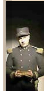
EL CENTRO NACIONAL DE LAS ARTES PRESENTA LA PUESTA EN ESCENA AMARO la cultura