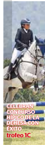
CELEBRAN CONCURSO HIPICO DE LA DEHESA CON ÉXITO trofeo 1C