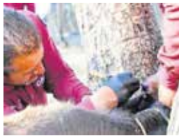
Mantienen la atención y control sanitaria.