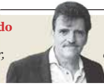
Enrique Serna "Globo y magnetismo entre dos enamorados distantes" - P. 25

E-commerce. De nuevo somos el motor económico de México: Horacio Duarte; en 2024, el sector logístico creció 12.8% más que el promedio nacional: Laura González