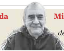
Miguel Carmena Laredo "Alemania muda de piel: menos bienestar, más cañones" - P. 17