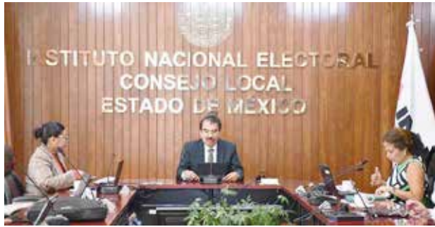
El padrón del INE registra crecimiento de la población

Pese a ello, el vocal ejecutivo destacó que actualmente la cobertura alcanza el 99.15 por ciento, porcentaje que prevén aumente conforme se acerque la elección, hasta ubicarse por encima del 99.8 por ciento.