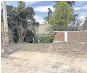
A 31 familias tuvieron que reubicarlas para que se puedan realizar las reparaciones y reconstrucciones.