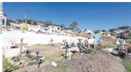
El pasado 18 de marzo entró en vigor el decreto 281 para regular su operatividad.