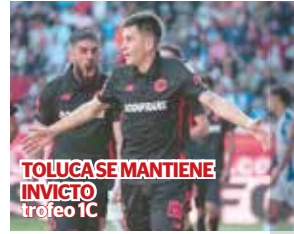
TOLUCA SE MANTIENE INVICTO trofeo 1C