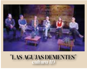
"LAS AGUJAS DEMENTES" cultura 1D