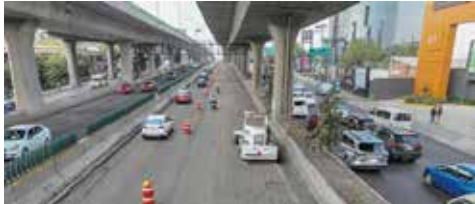
Los trabajos de rehabilitación del Periférico con buen avance

Con el avance sostenido de la reconstrucción integral del Periférico Norte, el Gobierno estatal afirmó que consolida una de las obras de movilidad más relevantes de las últimas décadas y recupera una vialidad que ha acompañado el desarrollo económico y social de la región por más de medio siglo.