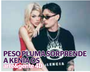
PESO PLUMA SORPRENDE A KENIA OS arte & gente 4D LENCIA