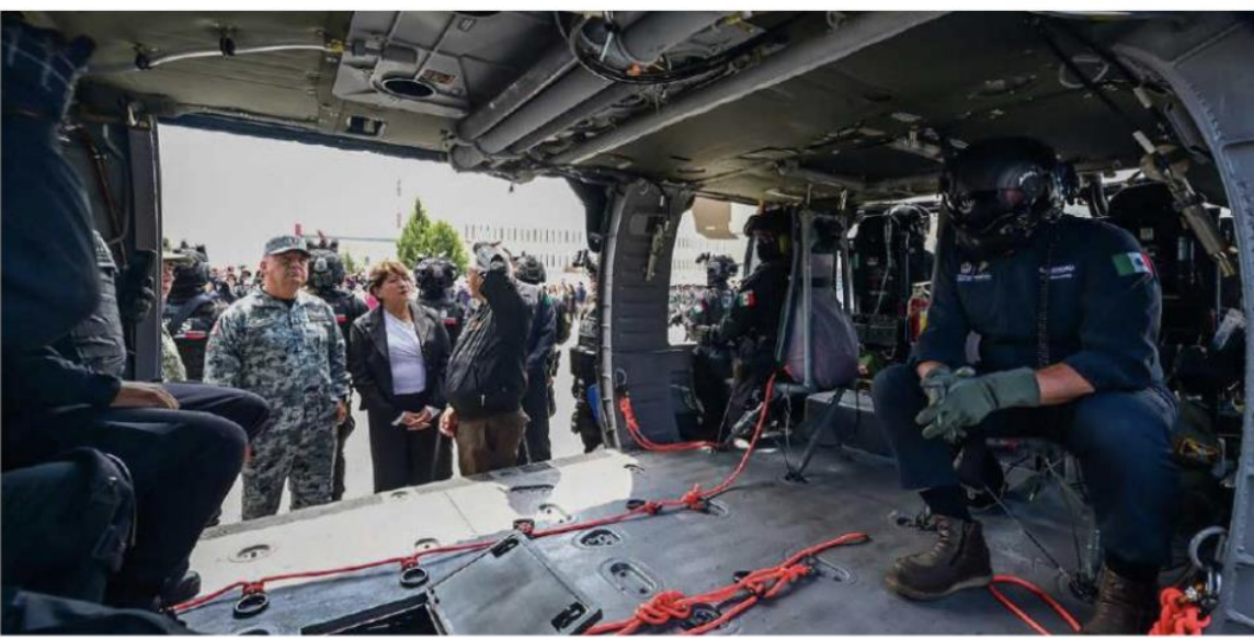
La adquisición de la aeronave Black Hawk es una inversión de los recursos públicos para mejorar los tiempos de respuesta de la ciudadanía.

• La tranquilidad de las familias mexiquenses es una prioridad de su administración y destacó que las nuevas herramientas permitirán fortalecer la coordinación institucional