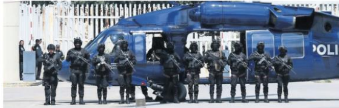
El Black Hawk cuenta con un helibalde con capacidad de 2 mil 900 litros para apoyar en la extinción de incendios forestales.

La nueva plataforma integra videovigilancia, inteligencia artificial, drones y herramientas de análisis para mejorar la respuesta ante emergencias y combatir la delincuencia. ● Gobierno A3