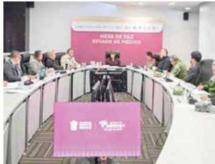
Mesa de Paz encabezada por la gobernadora Delfina Gómez Álvarez

de la coordinación interinstitucional y la implementación de acciones estratégicas de inteligencia y despliegues focalizados para atender las causas de la violencia y garantizar la tranquilidad de las y los mexiquenses", señaló el gobierno estatal.