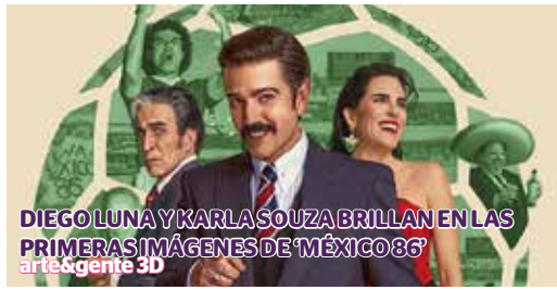
DIEGO LUNA Y KARLA SOUZA BRILLAN EN LAS PRIMERAS IMÁGENES DE 'MÉXICO 86'