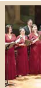
EL CONCIERTO ROMANTICISMO ALEMÁN, EN LAS VOCES DEL CORO DE MADRIGALISTAS