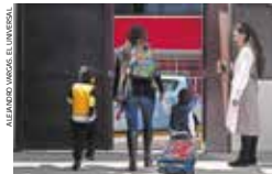
Ha faltado acompañamiento y voluntad de padres de familia para el protocolo.