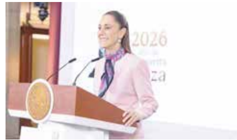
La presidenta Claudia Sheinbaum Pardo anunció en la conferencia mañana que el Tren Suburbano será privatizado