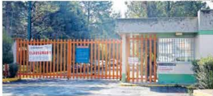
La sanción federal corresponde a un procedimiento iniciado en 2026

La planta es clave en el saneamiento del valle de Toluca, ya que sus descargas se conectan con la cuenca del río Lerma, uno de los