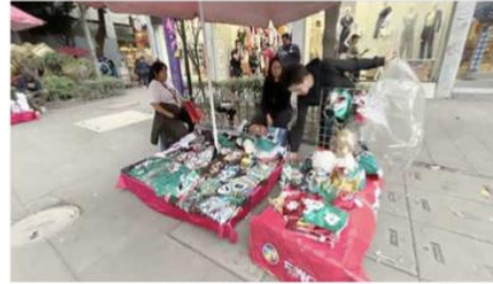
El ambulantaje en Toluca tiene invadidas las calles del centro, señalan empresarios

"Ya tienes que ir esquivando al de las playeras, al de los peluches, a la de las plantitas, a la que vende los elotes, y así se va complicando el tránsito peatonal en las banquetas. Si está descontrolado el tema. Realmente se percibe un