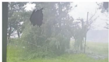
También se registraron daños en viviendas e infraestructura eléctrica.

Habitantes de la comunidad de La Planada se manifestaron y bloquearon el paso de camiones relacionados con la construcción del Tren México-Querétaro para exigir soluciones ante las afectaciones que, aseguran, ha generado la obra. Denunciaron daños en calles, problemas de movilidad. ● Municipios A5