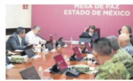
Atribuyen los resultados al despliegue operativo de las corporaciones de seguridad.

● El dato Robo de vehículo sin violencia registró la mayor reducción, con 47%.