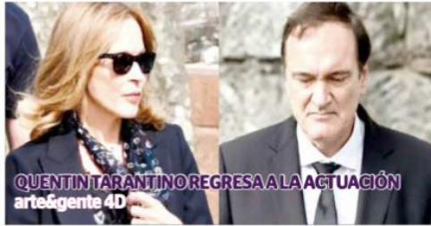
QUENTIN TARANTINO REGRESA A LA ACTUACIÓN arte&gente 4D