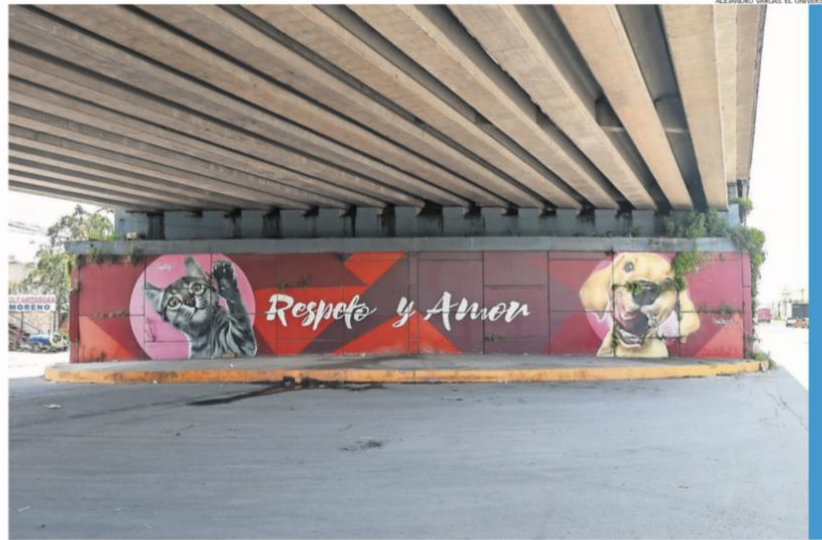
ALEJANDRO VARGAS EL UNIVERSAL

● La carretera Toluca-Naucalpan guarda una agradable sorpresa en uno de sus pasos vehiculares. Se trata de una obra artística dedicada a los animales de compañía que promueve el cuidado, la empatía y el buen trato hacia estos seres sintientes. La intervención, ubicada en los bajopuentes a la entrada de este municipio, llama la atención de automovilistas y trabajadores que diariamente transitan por el lugar, convirtiéndose en un punto que destaca por su creatividad y mensaje social. ●