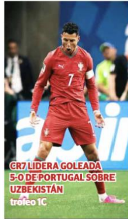
CR7 LIDERA GOLEADA 5-0 DE PORTUGAL SOBRE UZBEKISTÁN trofeo 1C