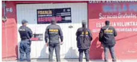
Los llamados "anexos" para rehabilitación contra adicciones están bajo investigación