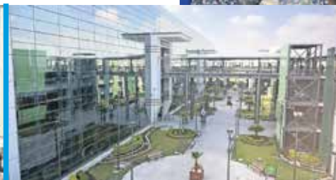
ARTURO CONTRERAS, EL UNIVERSAL