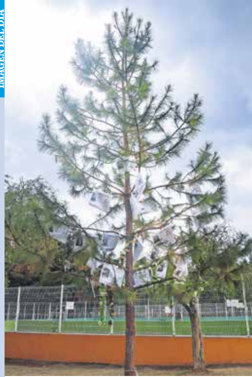
ALEJANDRO VARGAS, EL UNIVERSAL