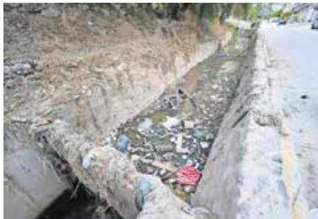
En puntos donde el acceso resulta complicado se emplea el malacateo.

El Atlas de Riesgo municipal advierte sobre zonas vulnerables donde escurrimientos de partes altas arrastran basura y sedimentos que tapan el drenaje y provocan anegamientos en calles, viviendas y comercios; ante ello, el gobierno local intensificó labores de limpieza. ● La dos A2