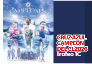
CRUZ AZUL CAMPEÓN DEL CL 2026 trofeo 1C