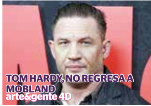
TOM HARDY, NO REGRESA A MOBLAND arte&gente 4D