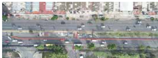
La Línea V del Mexibús en un circuito completo permitirá traslados más cortos

Reportaje El cáncer de mama es una enfermedad en la cual las células de la mama se alteran y multiplican sin control. Forman tumores que, de no ser tratados de forma oportuna, pueden propagarse por todo el cuerpo y causar la muerte, define el Instituto Nacional de Estadística y Geografía (Inegi). (MÁS INFORMACIÓN PÁG 4A ARELÍ DÍAZ)