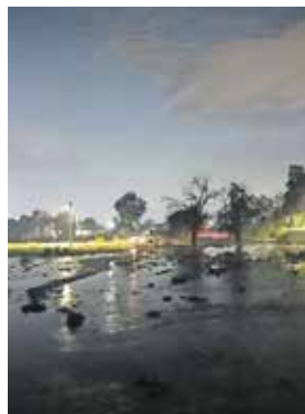
En algunos puntos de la región, el agua acumulada superó los 30 centímetros de altura en vialidades.

vil extrajeron agua del inmueble y establecieron diques de contención para evitar que el líquido continuara extendiéndose a las áreas habitadas después de la precipitación pluvial. Personal de la Coordinación General de Protección Civil y Gestión Integral del Riesgo (CGPCyGIR) operó bombas sumergibles. ● Seguridad A6