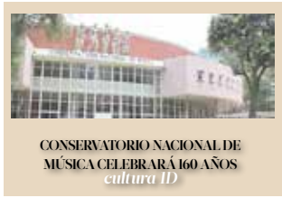
CONSERVATORIO NACIONAL DE MÚSICA CELEBRARÁ 160 AÑOS cultura ID