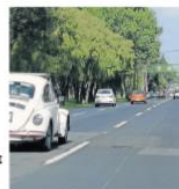
El análisis detallado estará listo hacia finales de 2026.

CUMPLE ACTUALMENTE con este requisito en ambas zonas metropolitanas.