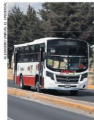
Con el objetivo de reducir costos en los próximos meses pondrán en marcha la Línea 6 del Mexibús.