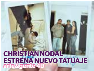
CHRISTIAN NODAL ESTRENA NUEVO TATUAJE arte&gente 4D