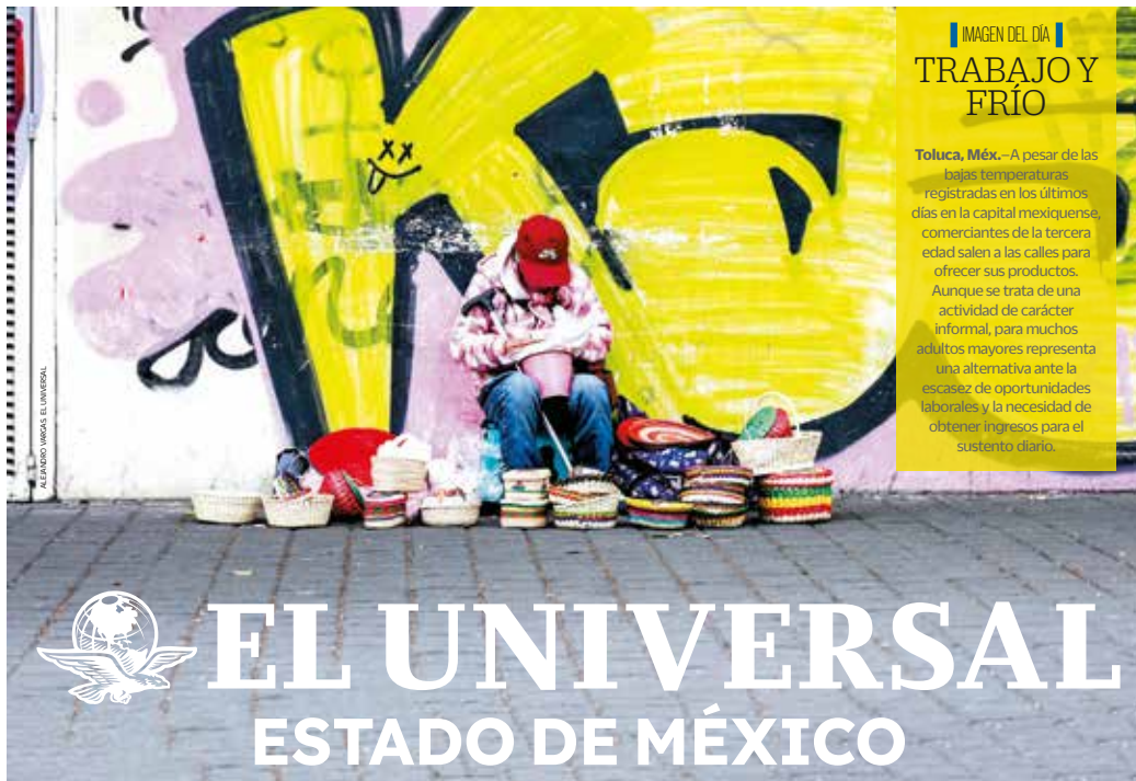
IMAGEN DEL DÍA TRABAJO Y FRÍO

Toluca, Méx. —A pesar de las bajas temperaturas registradas en los últimos días en la capital mexicana, comerciantes de la tercera edad salen a las calles para ofrecer sus productos. Aunque se trata de una actividad de carácter informal, para muchos adultos mayores representa una alternativa ante la escasez de oportunidades laborales y la necesidad de obtener ingresos para el sustento diario.