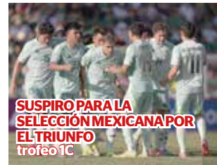
SUSPIRO PARA LA SELECCIÓN MEXICANA POR EL TRIUNFO trofeo 1C