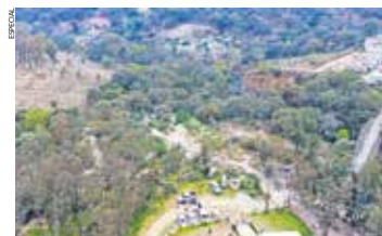
La presa Julianas, poco conocida y en buenas condiciones, permitiría captar 900 mil metros cúbicos de agua.