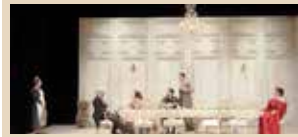
EL INSPECTOR LLAMA A LA PUERTA EXTIENDE TEMPORADA cultura 1D