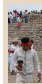
TRADICIÓN ANCESTRAL REGRESA A CAÑADA DELA VIRGEN El cultura