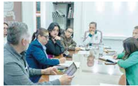
En el Cabildo de Toluca se pospuso la decisión del proyecto de la colonia Independencia

El presidente planteó integrar opiniones técnicas, ciudadanas y de la empresa, antes de emitir cualquier fallo sobre la construcción de bodegas. Por lo que, invitará a los funcionarios responsables de dependencias estatales a explicar los criterios, razones y consideraciones técnicas