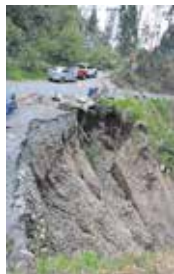
La semana pasada Protección Civil del Estado de México realizó una visita al lugar.