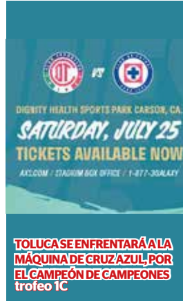
TOLUCA SE ENFRENTARÁ A LA MÁQUINA DE CRUZ AZUL POR EL CAMPEÓN DE CAMPEONES TRÓFICO IC