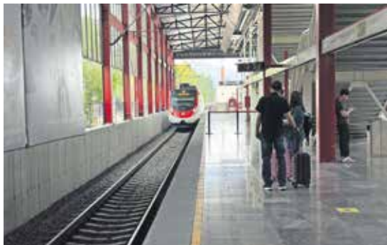
Hay usuarios del Tren Felipe Ángeles que consideran se ha convertido en una opción viable para poder trasladarse.

Usuarios del Tren Felipe Ángeles reportan retrasos, suspensiones temporales del servicio y deficiencias en estaciones intermedias a un mes de su inauguración. En Cueyamil persisten accesos provisionales, falta de transporte público y máquinas de recarga fuera de operación. Pese a las fallas, los pasajeros consideran viable la conexión por el ahorro en tiempo y costo. Este lunes concluye la tarifa promocional. ● Municipios A7