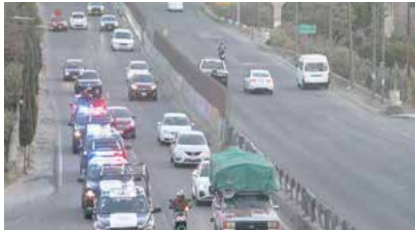
La Secretaría de Seguridad mantendrá la paz social, el orden público y la seguridad en vacaciones

pales y con las unidades de tránsito de los municipios, para la trazabilidad de los dispositivos viales", explicó la SSEM.