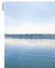
El suministro de agua está garantizado por dos años.