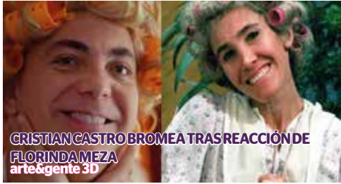
CRISTIAN CASTRO BROMEA TRAS REACCIÓN DE FLORINDA MEZA arte&gente 3D