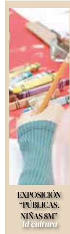
EXPOSICIÓN "PÚBLICAS. NIÑAS 8M" Id cultura