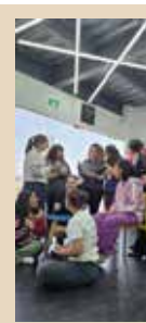
IMAGINATIO PRESENTA OFICIALMENTE "MAMMA MIA. EL MUSICAL" Id cultura