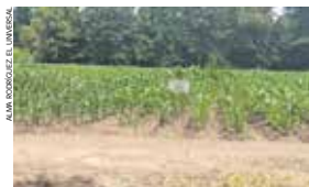
Productores mexicanos recibirán un precio de garantía.

15 MIL HECTÁREAS de maíz pérdidas por expansión urbana.