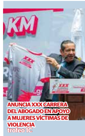
ANUNCIA XXX GARRERA DEL ABOGADO EN APOYO A MUJERES VÍCTIMAS DE VIOLENCIA trofeo 1C