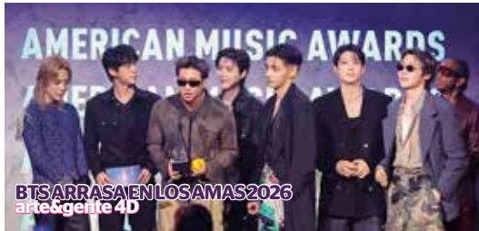
BTS ARRASA EN LOS AMAS 2026 arte & gente 4D