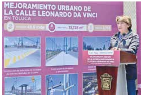
La gobernadora Delfina Gómez entregó rehabilitación de vialidades en la Zona Industrial de Toluca

Las acciones estuvieron a cargo de la Secretaría de De-