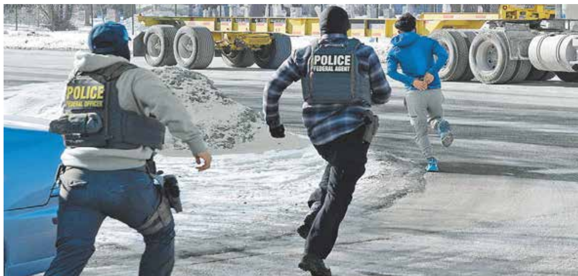
Un hombre esposado huye de agentes federales de inmigración en Minneapolis, Estados Unidos.

EU. Trump pega a su "excéntrico" jefe de la Border y apoya a Noem