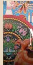
"MÉXICO EN UNA PIEZA" cultura ID