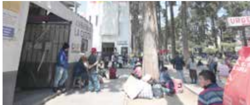
Familiares sufren del frío fuera del Hospital del Niño

"El Albergue Familiar La Casita" está para brindarte apoyo y un espacio digno mientras acompañas a tus familiares hospitalizados en el Valle de Toluca", destaca el DIFEM.