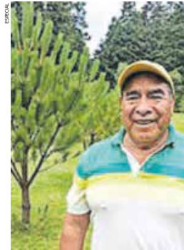
La recepción y registro de solicitudes iniciará este 28 de enero y concluirá el 27 de marzo.