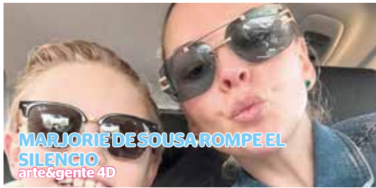
MARJORIE DE SOUSA ROMPE EL SILENCIO arte&gente 4D