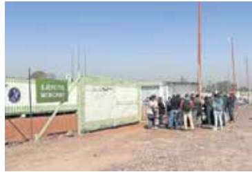
ARTURO CONTRERAS/EL UNIVERSAL

"No estamos pidiendo más que las puras necesidades de Teoloyucan y sus usos y costumbres porque hay puentes que por su necesidad se requieren de 8 metros de ancho"