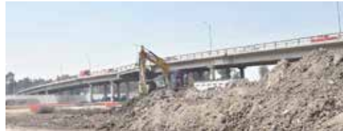
En conferencia de prensa la Secretaría de Infraestructura, Comunicaciones y Transportes habló de los avances en los Puentes Alameda Oriente

podría parecer poco aseguró que por las personas que van en los vehículos, es una cantidad considerable en el ahorro que se tiene.