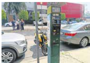
El alcalde Isaac Montoya defendió la implementación del programa y argumentó que busca regular el uso de los espacios de estacionamiento.