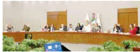
El IEEM otorgó el registro como partido político local a Podemos

PRIMERA LISTA DE CONVOCADOS POR JAVIER AGUIRRE trofeo 1C