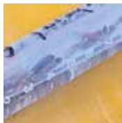
El objetivo del foro fue informar, concientizar y promover acciones.