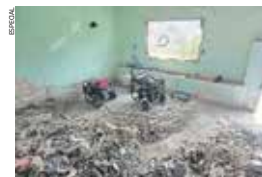
Los trabajos comenzaron hace dos semanas en la primera franja considerada de riesgo.