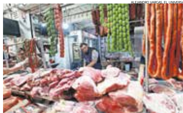
El alza en el precio de la carne de res, de acuerdo con comerciantes, se debe a la baja llegada de ganado.

El kilo de bistec alcanza hasta 230 pesos en mercados de Toluca, situación que ha obligado a las familias reducir su consumo y buscar alternativas más económicas. Comerciantes atribuyen el alza a la baja llegada de ganado y a las afectaciones provocadas por el gusano barrenador. ● La Dos A2