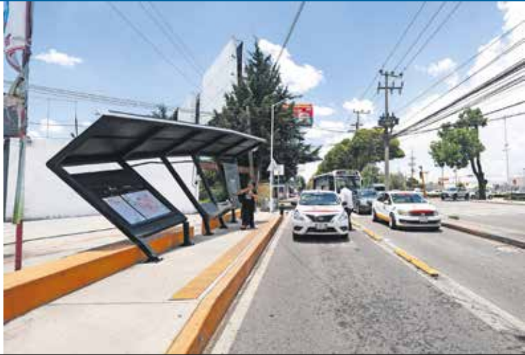
ALEJANDRO VARGAS, EL UNIVERSAL

● Un camión de carga pesada impactó y dejó totalmente doblado uno de los nuevos paraderos de la carretera Toluca-Tenango, a la altura de Metepec. A pesar del daño y de que las autoridades municipales aún no acuden a atender el reporte tras varios días, los usuarios del transporte público continúan utilizándolo debido a la gran ayuda que les brinda, especialmente durante la noche. ●