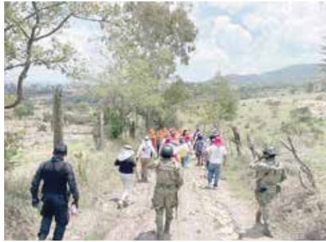
Inicia Comisión de Búsqueda trabajos en Valle de México

Derivado de la información recolectada en los recorridos, detalló, se procesará y analizará