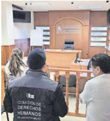
86 municipios tienen un área de resguardo de infractores menores de edad.

Solo una parte cuenta con espacios para valoración médica y psicosocial de infractores, lo que evidencia rezagos en su operación; de los 125 juzgados evaluados, menos de la mitad dispone de infraestructura completa para atender faltas administrativas y garantizar procesos adecuados. ● Gobierno A3