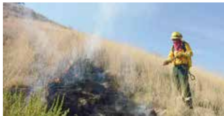
Se activó el Plan de Vigilancia, Prevención y Atención a Fuegos Forestales durante la Semana Santa

En municipios como Valle de Bravo, el operativo cuenta con apoyo de organizaciones civiles que han donado equipo y herramientas para reforzar las labores de combate de incendios.