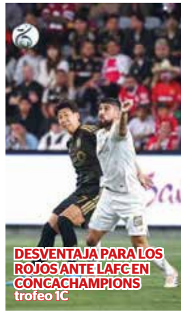
DESVENTAJA PARA LOS ROJOS ANTE LAFC EN CONCACAMPIONS trofeo IC