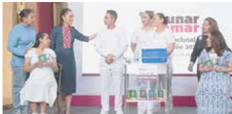
Claudia Sheinbaum anunció que la Semana Nacional de Vacunación se extenderá durante todo el mes de mayo.

quinto de primaria y de 11 años; contra el tétanos (Difteria, la revacunación debe ser cada 10 años; contra la influenza en caso de factores de riesgo; contra el sarampión/rubéola, solo en caso de no tener el esquema completo; contra hepatitis B en caso de no contar con ninguna dosis y contra el Covid-19 si se tiene factores de riesgo. Para adultos entre 20 y 59 años las vacunas que de-