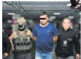
La detención se llevó a cabo con apoyo de elementos de la Secretaría de Seguridad del Edomex.

● La pasión por el Toluca trasciende la cancha y se instala en las calles de la capital mexicana, donde el rojo y blanco dominan el paisaje cotidiano. En medio de la Ligilla y con compromisos internacionales, la afición acompaña al equipo en cada jornada. Comerciantes y ciudadanos portan con orgullo los colores escarlatas. ●