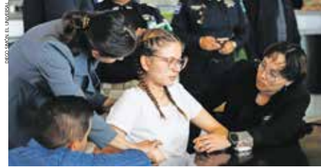
Su defensa exige que el caso avance sin dilaciones.

El ataque ocurrió el 10 de marzo de 2023 en una vivienda del fraccionamiento La Guadalupe de Ecatepec.