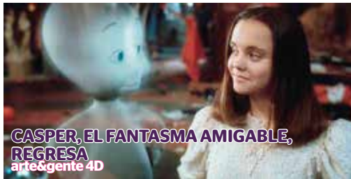
CASPER, EL FANTASMA AMIGABLE, REGRESA arte&gente 4D