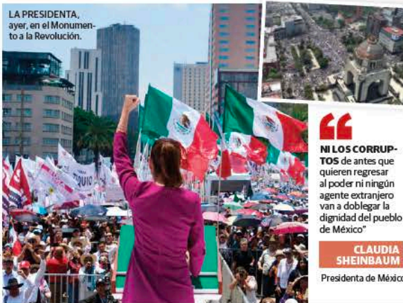
LA PRESIDENTA, ayer, en el Monumento a la Revolución.

"Vienen por unos, luego por otros, hasta que oficinas del Departamento de Justicia se vuelven el principal elector de México; no lo podemos permitir"; crítica a Calderón, Fox y Zedillo