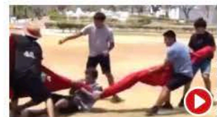
EL JALONEO con el lábaro patrio.