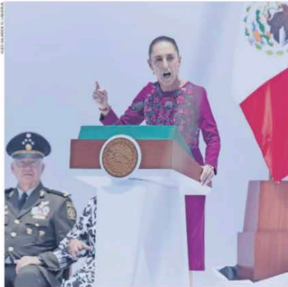
Al encabezar su segunda rendición de cuentas, la presidenta Claudia Sheinbaum subió el tono contra Estados Unidos y criticó que pretenda inmiscuirse en las elecciones en México.

Cuestiona que EU busque entrometirse con las acusaciones contra políticos