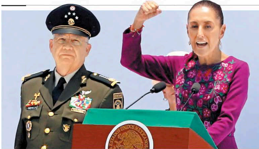
La Presidenta en el Monumento a la Revolución, desde donde dio su mensaje a dos años del triunfo en las urnas. JAVIER RÍOS

“Claudia, obradorista leal, pero con decisiones propias” - P. 21