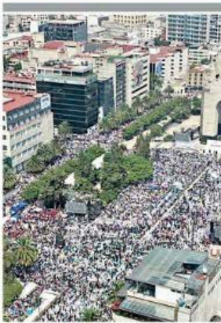
El millón de Sheinbaum convocó a 130 mil personas, según el gobierno morenista de la CDMX.