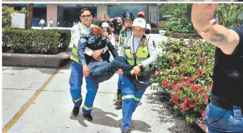
Embozados usan un poste de ariete y mujer policía inconsciente tras la refriega. JAVIER RÍOS