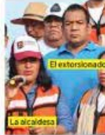
■ El extorsionador