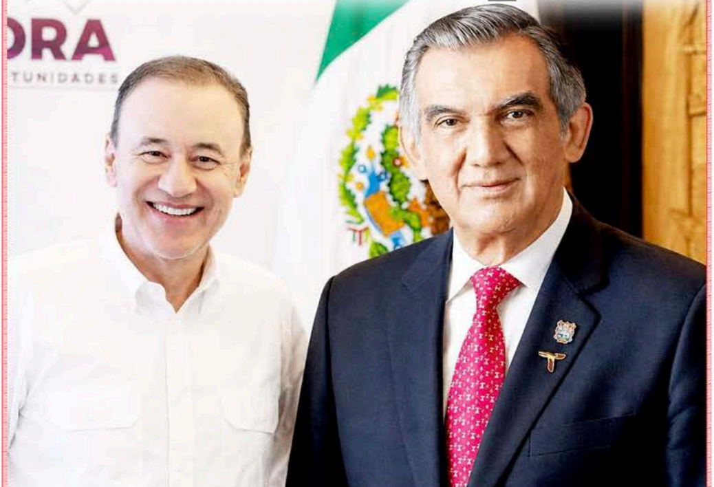
Alfonso Durazo y Américo Villarreal