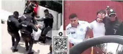
■ LA AGRESIÓN