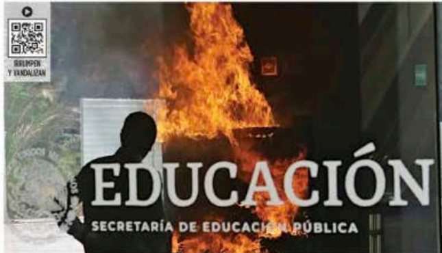
■ Un grupo de integrantes de la CNTE prendió fuego en las instalaciones de la SEP en Avenida Universidad.

Les pide Delgado reunirse 'donde sea, cuando sea, donde quieran'