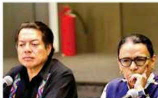
■ El titular de la SEP, Mario Delgado, y la de Gobernación, Rosa Isela Rodríguez, buscan apagar el fuego de la CNTE.

varias horas lanzando consignas, con pancartas, silbas, bocanás y algunos más, con resacas, palos, martillos, tubos y petardos. A las 11:00, algunos encapuchados intentaron derribar con tubos el muro del inmueble, pero fueron replegados con estroperos.