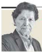
Jorge Zepeda Patterson "La mandataria tildada como 'débil', más fuerte que nunca" - P. 16