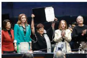
ERNESTINA Godoy, ayer, en el Senado.

Compite en terna de 3 mujeres; el martes la Presidenta envió la lista; la eligen como fiscal para periodo de 9 años con 97 votos a favor sumados los de MC, 19 nulos y 11 en contra