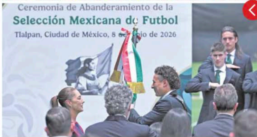
Ceremonia de Abanderamiento de la Selección Mexicana de Fútbol Tlalpan, Ciudad de México, 8 de junio de 2026