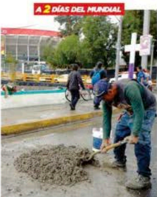
■ A marchas forzadas y entre la lluvia, continúan las obras fuera del Estadio mundialista en la CDMX.