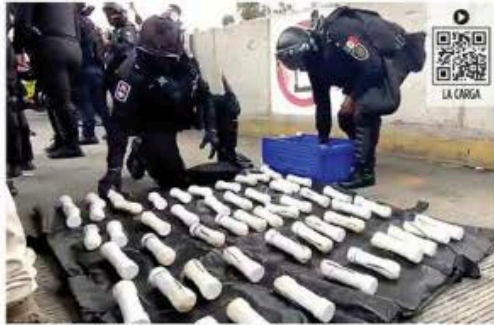
■ La policía decomisó 59 cilindros con material explosivo en uno de los camiones que transportaba a normalistas de Ayoztzinapa que llegaron ayer a la CDMX.

En los autobuses viajaban estudiantes y padres de familia de los 48 normalistas desaparecidos de Ayoztzinapa que llegaron a México para sumarse a las protestas que organiza la CNTE.