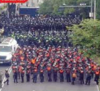
La Policía impidió a la CNTE llegar al Azteca.