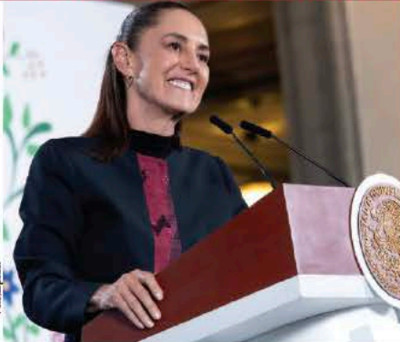
LA PRESIDENTA, ayer, en Palacio.

EMITE Sheinbaum medida que interrumpe clases en CDMX y establece home office para favorecer movilidad mañana; se unen 9 estados, entre ellos Edomex, Jalisco, Michoacán... págs. 10 y 18