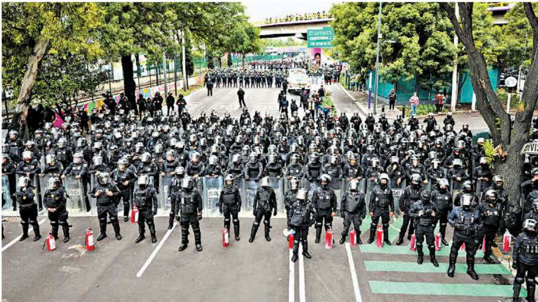
Unos 500 uniformados frenaron la marcha de los manifestantes rumbo a la sede de la inauguración.

Joaquín López-Dóriga "Estiran la liga a extremos no vistos ni previstos" - p. 3