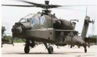
Un helicóptero de EU, similar al de la imagen, fue derribado ayer por Irán.

TV Azteca anunció a su petición de concurso —hasta ahora no conocida públicamente— una lista de mil 970 deudas, que suman 23 mil 345 millones de pesos, 147 por ciento más que los 9 mil 449 millones que debía al cierre de 2012.