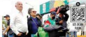
Olimari obtuvo una suspensión provisional de un juez para frenar la demanda de palcohábientes.