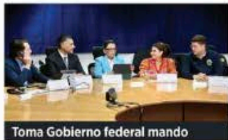
Toma Gobierno federal mando

Los comerciantes argumentaron que las protestas han provocado una fuerte caída en sus ventas. Algunos