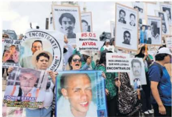
Colectivos de madres buscadoras de al menos 11 estados del país se manifestaron ayer domingo, 10 de mayo, para exigir a las autoridades que les ayuden a buscar y encontrar a sus hijos desaparecidos.

Salamanca: matan a una mamá buscadora y a su hija.