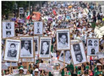
PROTESTA, ayer, en Reforma.

UNO de cada tres mexicanos ha enfrentado al menos un problema de este tipo en el año; siete de cada 10 conflictos, entre vecinos, la principal causa, el ruido. pág. 3