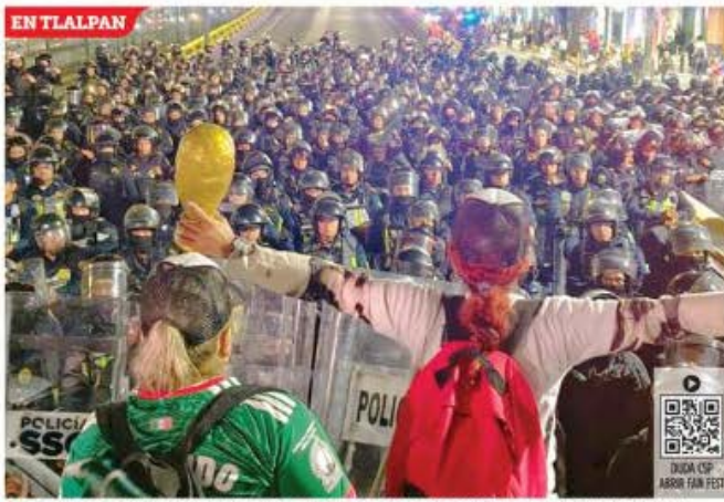
4 Familiares de desaparecidos que intentaban llegar al Estadio fueron frenados por la Policía cerca de la estación El Vergel.