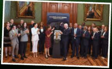
SHEINBAUM, ayer, con Infantino, presidente de la FIFA, en Palacio Nacional.

Histórico , el país, sede ya de 3 mundiales; éste, trinacional y con 48 equipos; 11 de Aguirre y show con Shakira, listos; museos invitan a ver la inauguración págs. 4, 5, 11, 16, 19, 29 y 30