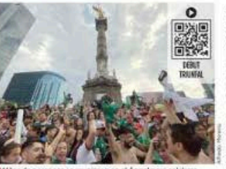
Miles de personas se reunieron en el Ángel para celebrar el triunfo del Tri.

JORGE RICARDO El festivo de México llegó, a pesar de la tormenta. No la de bloqueo de la CNTE en el Zócalo, que le quitó a la Presidenta Claudia Sheinbaum la posibilidad de salir a recibir los aplausos de su público en la inauguración del Mundial de Fútbol en el Zócalo, ni el de las madres buscadoras de sus más de 130 mil hijos desaparecidos que se manifestaban al pie del Ángel. Fue una simple y real tormenta, de neblina y ráfagas de lluvia que ahuyentó a la afición, que demostró que la realidad sigue siendo mejor que las ilusiones. Hasta el silbatazo final del partido México-Sudáfrica todo era alegría. Qué fácil la