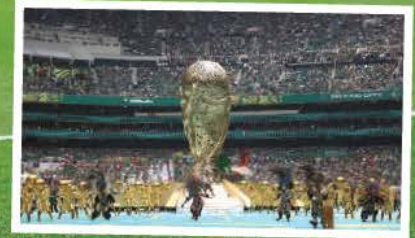
EL ESPECTÁCULO inicial, ayer, en el Azteca.

ARRANCA TERCERA COPA DEL MUNDO EN MÉXICO