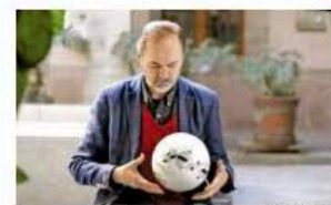
LLEVA LA PASIÓN EN EL ADN. El escritor Juan Villoro defiende el fútbol, una de las constantes en su vida, como el deporte más democrático. EXPRESIONES / 21