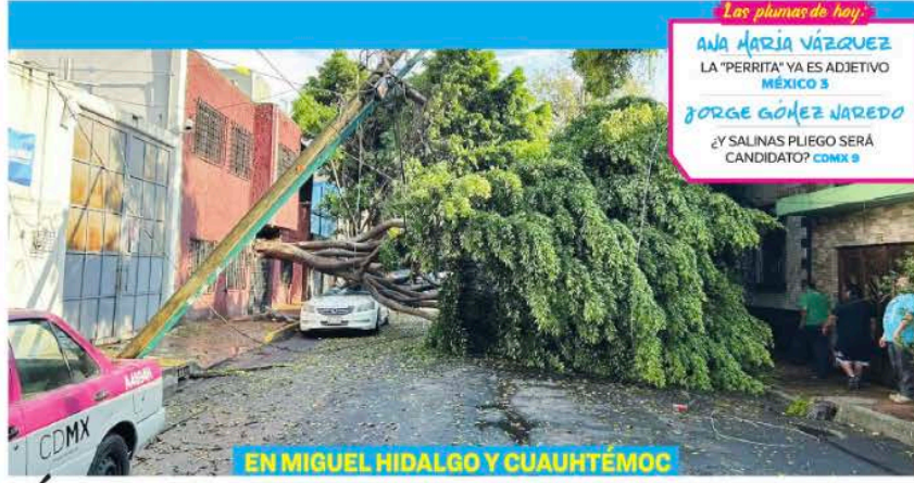
EN MIGUEL HIDALGO Y CUAUHTÉMOC