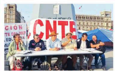
LOS ACUSAN DE FRAUDE Y MANIPULACIÓN DE VOTOS