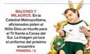
BALONES Y MILAGROS. En la Catedral Metropolitana, aficionados piden al Niño Dios un triunfo para el Tri frente a Corea del Sur. La imagen ya luce el uniforme del próximo encuentro PRIMERA / 6