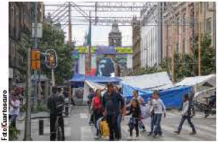
CAMPAMENTO de la CNTE, ayer, en el Zócalo.

MAGISTERIO disidente va por tercera semana de protestas; en sondeo en Oaxaca reportan un posible fraude; mayoría habría pedido receso. pág. 9