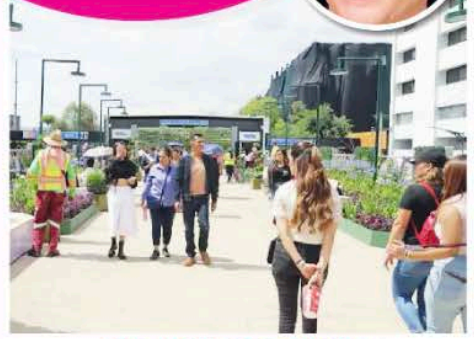
POR LA CALZADA FLOTANTE Y CICLOVÍA ELEVADA